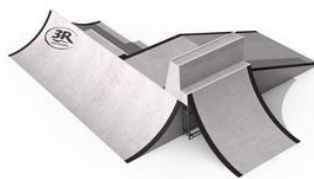
Module « saut »