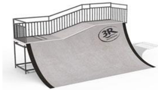
Module « lanceur »