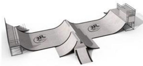
Module « rampe »