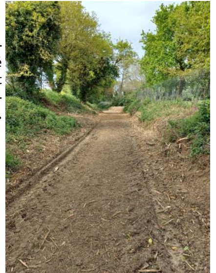
Chemin de Kermenguy à Pommerit-Jaudy

Le chemin derrière la SPA a été refait à Pommerit-Jaudy .